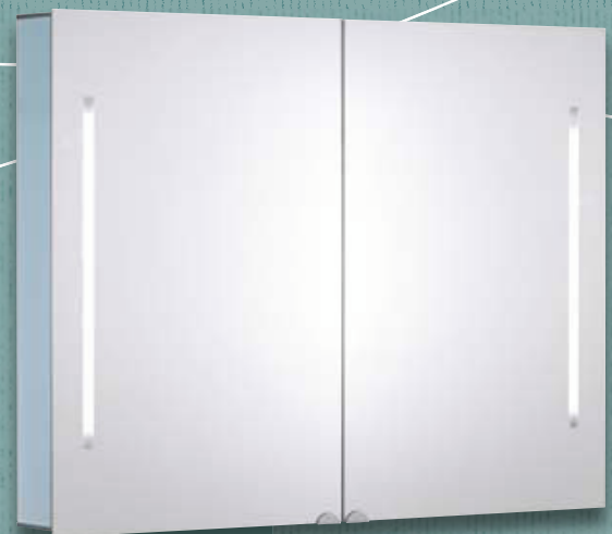
Modell-Nr. 900 101

Korpus und Rückwand Sicherheitsglas, weiß-aluminium, bedruckt Body and rear panel safety glass, white aluminium, printed