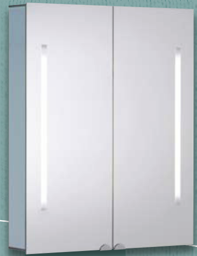
Modell-Nr. 900 060