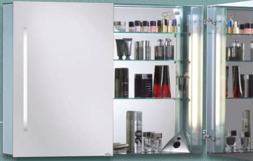
Modell-Nr. 900 101 / 900 102