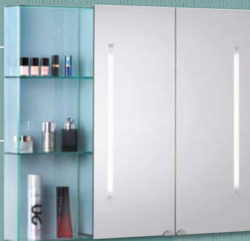
Modell-Nr. 900 060 / 900 030