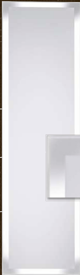
Modell-Nr. 400 027