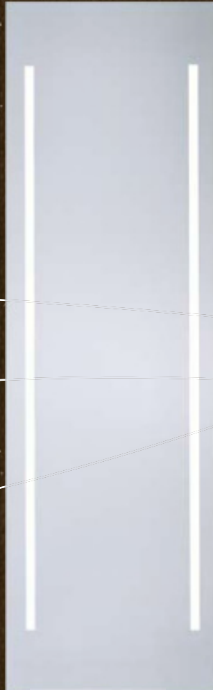
Modell-Nr. 400 025